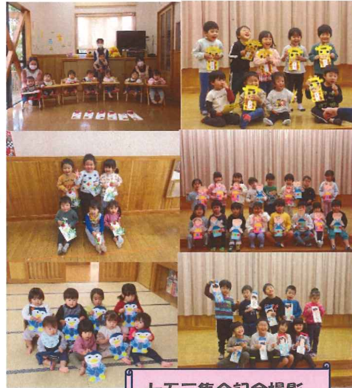
七五三集会記念撮影

1年間お世話になりました 各行事の際には、保護者の皆様からたくさんのご協力を頂き、ありがとうございました。来年も今年同様お願いいたします。